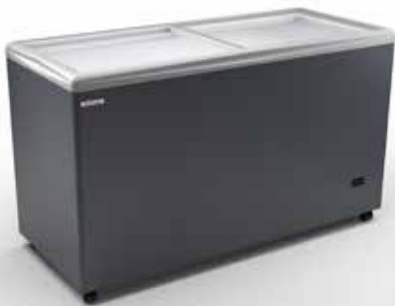
RIO H 150