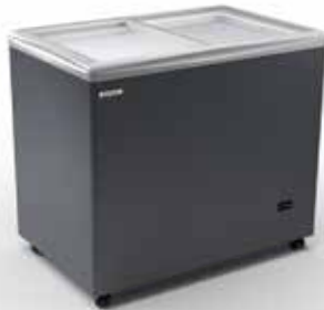
RIO H 100