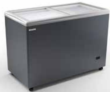
RIO H 125