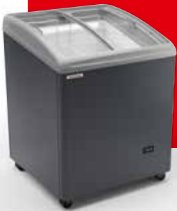
RIO S 68

RIO kann von beiden Seiten bedient werden und bietet durch die unterschiedlichen Varianten die ideale Lösung für jede Fläche.