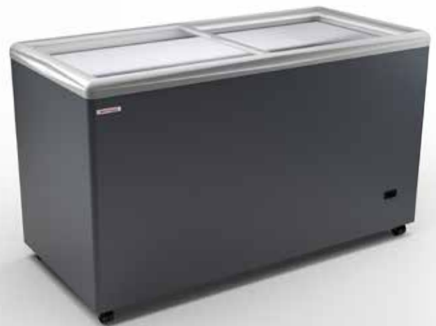
SAO PAULO H150