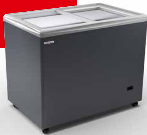
SAO PAULO H100