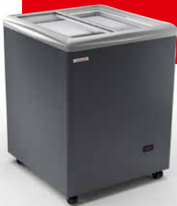
SAO PAULO H68

SAO PAULO kann von beiden Seiten bedient werden und bietet durch die unterschiedlichen Varianten die ideale Lösung für jede Fläche.