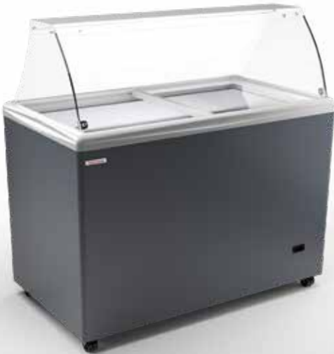
SAO PAULO H125 SCOOP