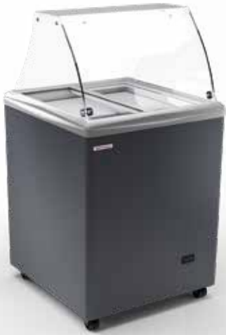
SAO PAULO H68 SCOOP