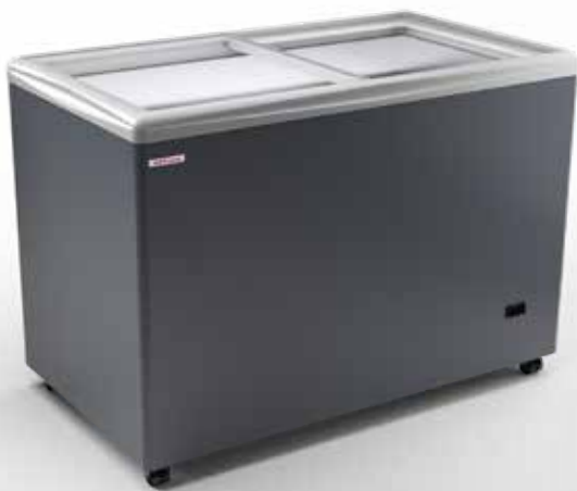
SAO PAULO H125