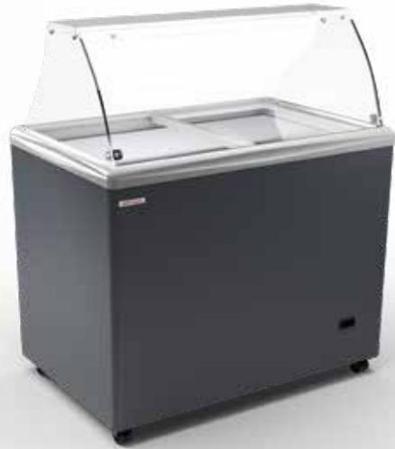
SAO PAULO H100 SCOOP