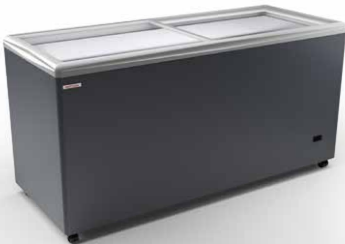
SAO PAULO H175