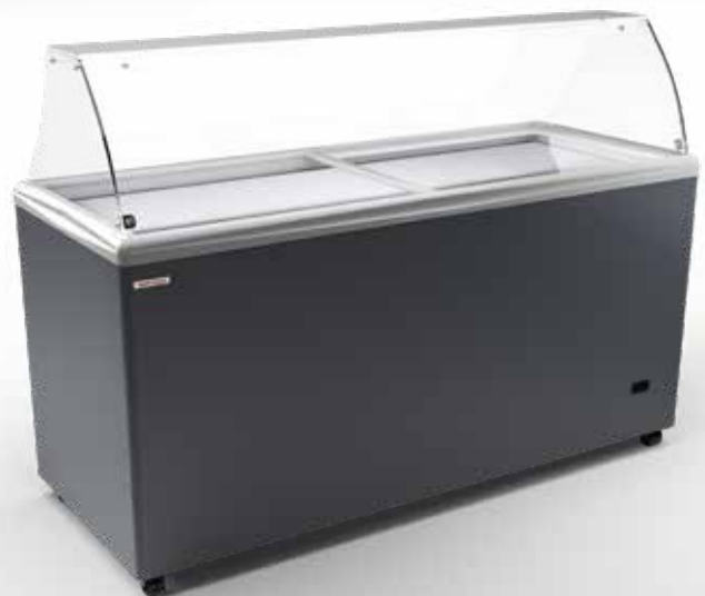
SAO PAULO H175 SCOOP