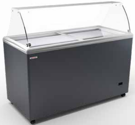
SAO PAULO H150 SCOOP