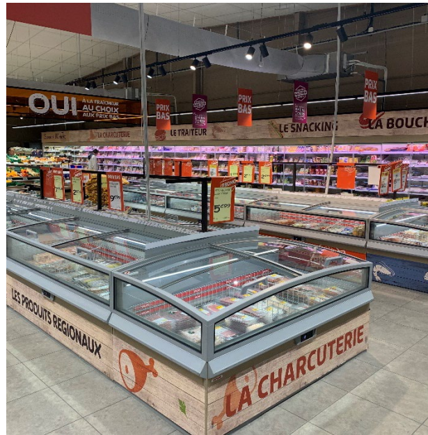
一个月内能耗比较

Netto Epernay 是第一家 100% 配备 AHT 冷冻冷藏设备的商店（具有完整的即插即用解决方案，但不包括冷藏室）。Netto Epernay 的销售额增长了 2%。