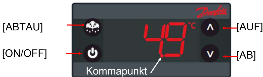
Abb. 1: Bedienungselemente und Displayanzeigen (Symboldarstellung)

Als Bedienungselemente stehen Tasten zur Verfügung, die folgendermaßen belegt sind: